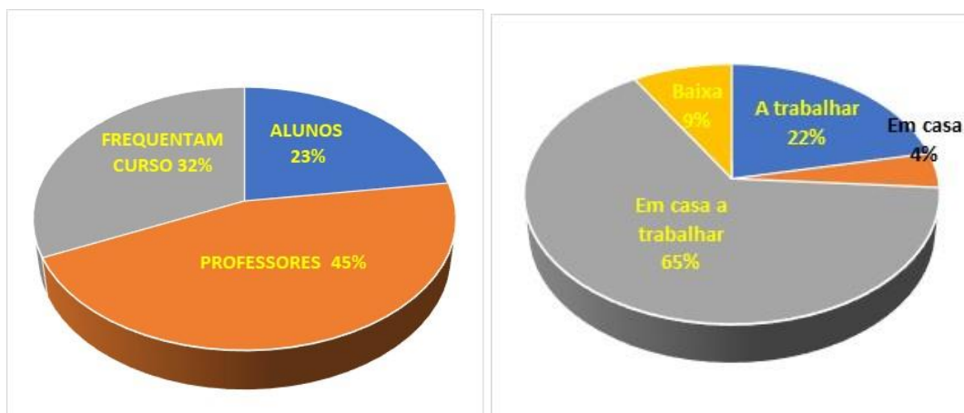
Gráficos: Quem somos e Como vivemos e confinamento